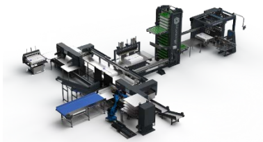
baumannperfecta – vollautomatische Schüttel- und Schneidelinie für Pharmazieanwendungen (Abbildung ähnlich).