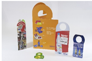
All In – Stanzlösungen mit Schweizer Präzision, BOGRAMA präsentiert die Vielseitigkeit ihrer rotativen Stanzttechnik.