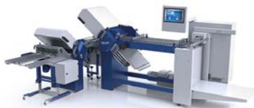
Die neue H+H S45 ist für die Fertigung kurz gefalzter Produkte geeignet.